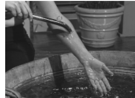
Die Bewegung des Wasserstrahls sollte bei Kneipp-Güssen immer zum Herzen hin gerichtet sein.

Beim Selbstgießen wird die Brause in die rechte Hand genommen. Bei der Selbstdurchführung prüft und wählt der Gießende die für sein Gesicht angenehmste Temperatur des Wasserstrahls. Gießfolge: Man beginnt an der Stirnseite und umgießt langsam das Gesicht im Uhrzeigersinn. Die Stirn wird durch einige Quergießungen besonders berücksichtigt.