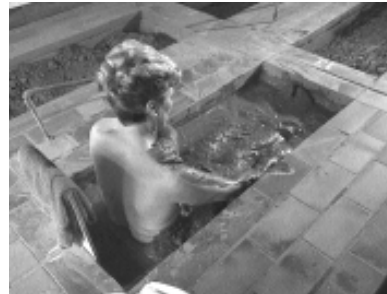
Ein Lehmbad wirkt sich überaus günstig auf den gesamten Stoffwechsel aus.

Bei Lehm handelt es sich, geologisch betrachtet, um ein durch Verwitterung und Umlagerung entstandenes Sediment. Er weist eine spezielle Zusammensetzung aus sandigen und tonigen Komponenten auf. Für seine therapeutische Wirkung ist nicht zuletzt die hohe basische Eigenschaft verantwortlich. So ist Lehm ein guter Säurebinder.