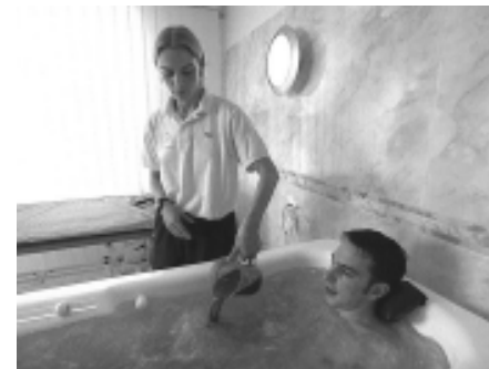
Ein Meerwassersprudelbad wird mit speziellen Braunalgen versetzt. Es massiert muskuläre Anspannungen weg.

An der Küste Mecklenburg-Vorpommerns findet sich das einzige, vom Verband anerkannte Haus, welches alle Anforderungen erfüllt. Allerdings sind diese Therapien sehr teuer. Unabhängige wissenschaftliche Beweise über medizinische Wirkungen stehen noch aus. Wer trotzdem die Wohltaten des Meeres für sich nutzen will, der kann das auch ohne viel Geld auf eigene Faust tun. Schon das tiefe Durchatmen am Meer kostet nichts.