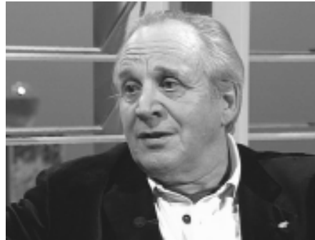
Der Immunologe Prof. Uhlenbruck weiß, wie wichtig Lachen für unsere Gesundheit ist.

Seit einiger Zeit werden Lach-Workshops und –seminare und sogar Lachyoga angeboten, die