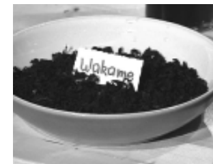
Diese Algen (Arame, Hijiki, Kombu oder Wakame) sind in Bio- oder Asia-Läden erhältlich.