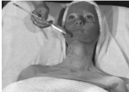
Eine Gesichtsmaske aus Heilerde ist schnell angerührt und macht den Teint in einer Viertelstunde zart.

mit Schmerzlinderung einhergeht. Wirksam sind Heilerde-Umschläge daher z. B. auch bei Verstauchungen, die ja sehr schmerzhaft sind.