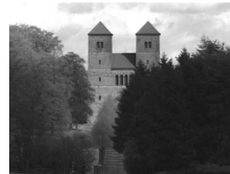
Die Atmosphäre der Ruhe, die man in einem Kloster erlebt, kann der Seele wieder Flügel verleihen.

von permanenter Reizüberflutung wirken ein paar stille Tage oft Wunder. Viele Klöster in Deutschland, die häufig landschaftlich herrlich gelegen sind, bieten Un-