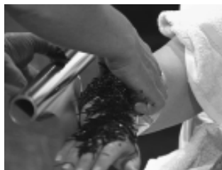
Eine Algenpackung lässt sich ganz einfach zu Hause selber herstellen und auf die Haut auftragen.

schwimmenden Algenteile als störend empfunden werden, einfach in ein Stück Verbandsschlauch geben, zuknoten, und ab in die Wanne.