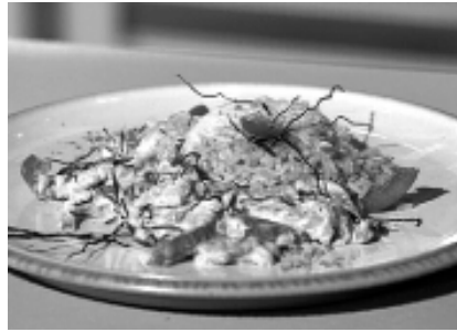
Die Algenpfanne schmeckt lecker und ist besonders nährstoffreich.

gut abspülen. Zusammen mit den klein geschnittenen Zwiebeln andünsten und mit den anderen Zutaten in der Pfanne garen. Die Banane erst am Schluss zugeben, weil sie sonst zerfällt.